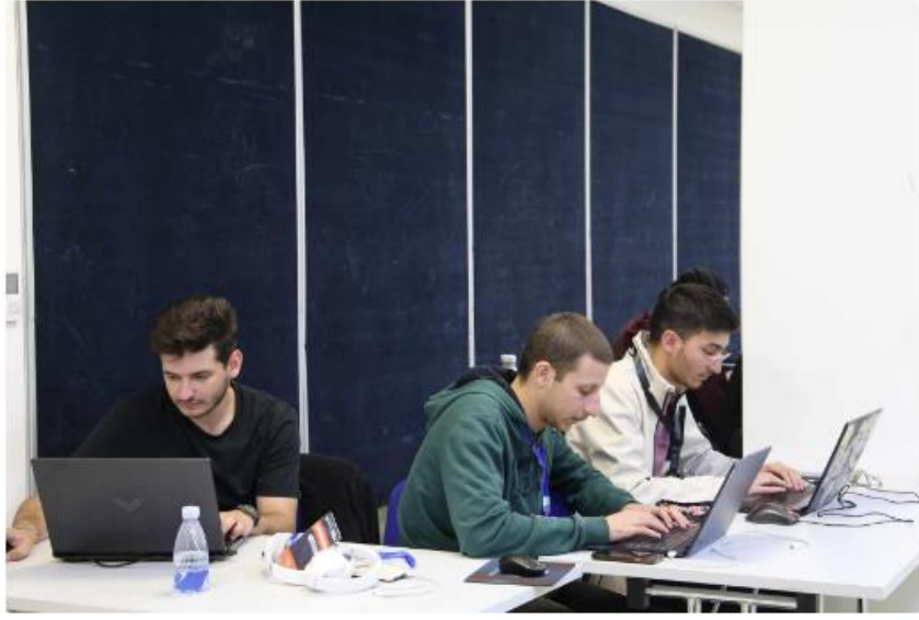
نبأ الأردن - وليد حماد

محلّيات | 2024-11-07 | 03:38 pm - الخميس